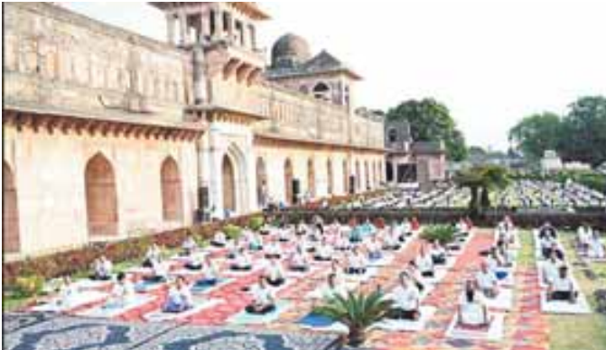
योगाभ्यास किया गया।

प्रधानमंत्री का संदेश: 'योग मानव जीवन का प्रकाश और संतुलन का आधार' - कार्यक्रम के दौरान प्रधानमंत्री नरेन्द्र मोदी जी का राष्ट्र के नाम संदेश बेहद एकाग्रता के साथ सुना। प्रधानमंत्री ने अपने संदेश में पूरे मानव समाज को अंतर्राष्ट्रीय योग दिवस की शुभकामनाएं देते हुए कहा कि- 'योग सबको जोड़ता है। भारत में हम जानते हैं और देखते आते हैं कि योग मानव जीवन का चेतना के साथ, ऊर्जा के साथ प्रकाश भी है। संतुलन ही योग का आधार है। इस अवसर पर करोड़ों लोग योग से जुड़ रहे हैं और हमें योग को अपने जीवन का हिस्सा बनाना चाहिए।' इसी दिव्य संदेश को आत्मसात करते हुए इस वर्ष की थीम 'स्वस्थ आयु के लिए योग' पर सामूहिक