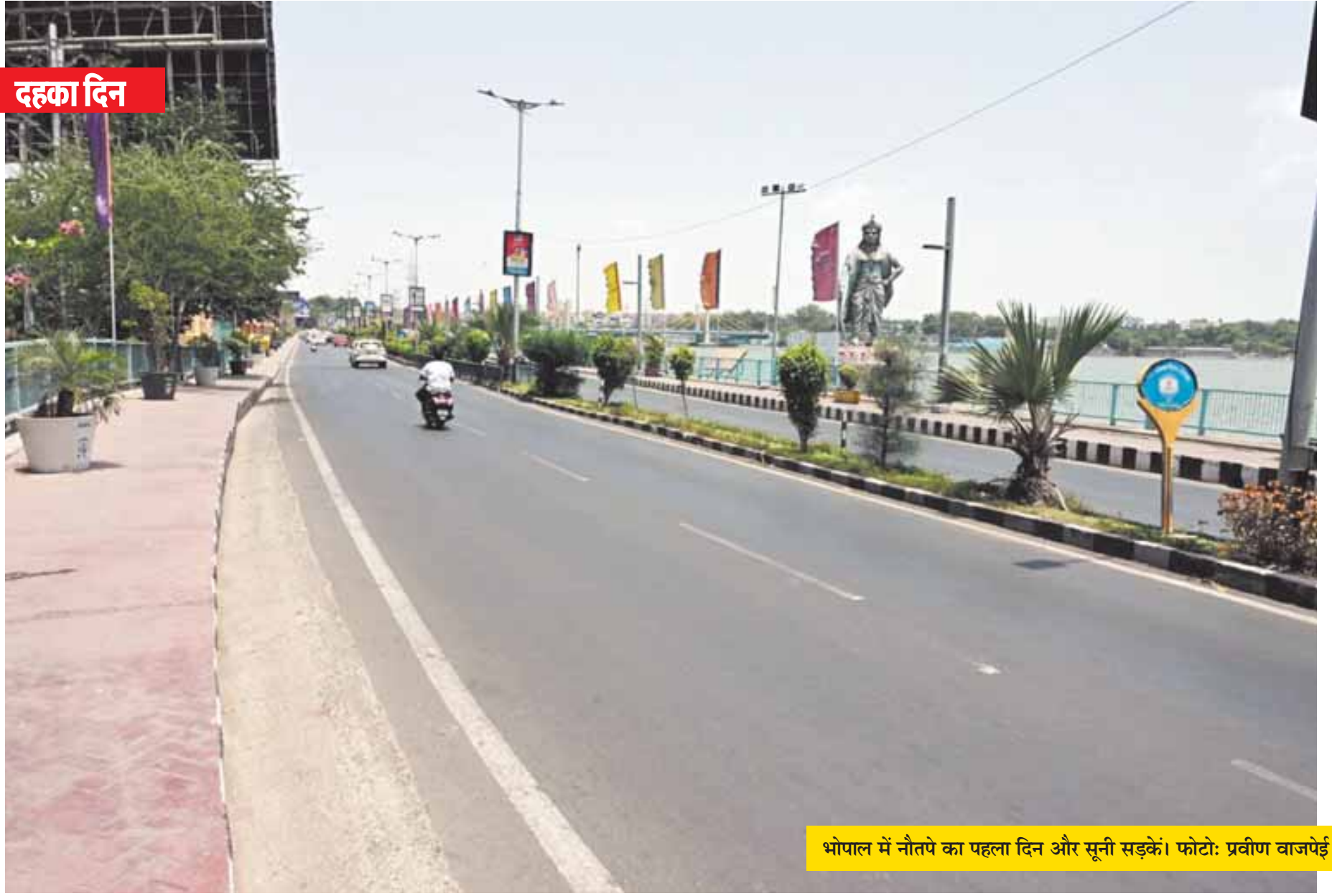
भोपाल में नौतपे का पहला दिन और सूनी सड़कें।